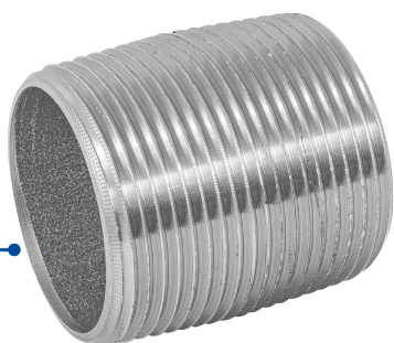
Conexión roscable de 1 1/4" (32 mm)