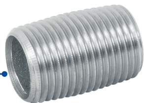
Conexión roscable de 1/2" (13 mm)