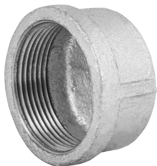
Conexión roscable de 1 1/2" NPT