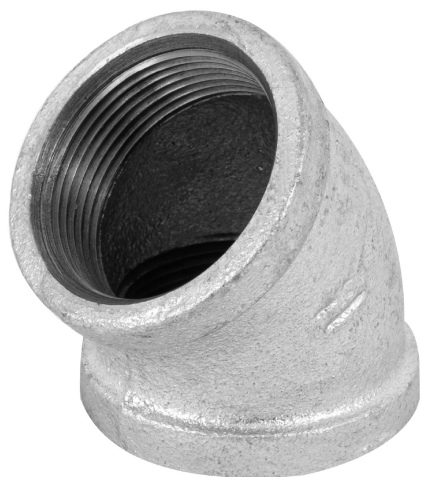
Conexiones roscables de 1 1/2" (38 mm)