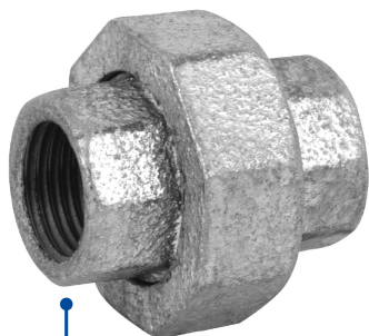
Conexiones roscables de 1/2" NPT